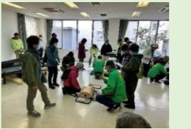
心肺蘇生訓練の様子