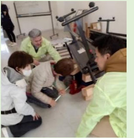
倒壊した家屋に挟まれた人をジャッキアップして救助の様子

なお、北陵地区自主防災会が優良自主防災組織として 兵庫県知事表彰 を受け、川西市危機管理課長から伝達されました。 おめでとうございます。